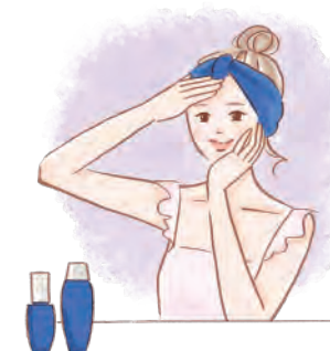
左から、ローズエステリッチローション(化粧水)155mL、 リペアモイストWエッセンス(美容液) 50 mL