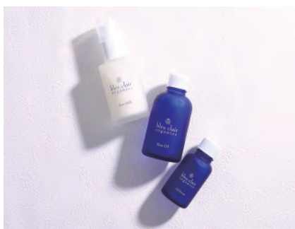
右から、オイルセラム (オイル美容液)、ローズオイル (美容オイル)、ローズミルク (乳液)

UV ラグジュアリーデークリーム II をパール 1~2 個分手に取り、ローズリッチ UV パウダーを適量加えます。右の写真くらいで重量約 0.1g。そこにローズオイル、オイルセラムなどを適量足します。これを手のひらでよく混ぜれば、無添加のクリームファンデーションの完成。潤いたっぷり艶感ある仕上がりになります。