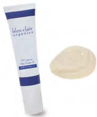
UV ラグジュアリーデイクリーム II SPF23/PA++ 35g

合成界面活性剤や合成紫外線吸収剤などの 化学剤を一切使用しない徹底的な無添加の UV ラグジュアリーデイクリーム II は、ブル ークレールオーガニクスの大人気アイテム。 白浮きやべたつき感がなくご使用いただけ ます。SPF23/PA++ という数値は、紫 外線をしっかりガードしながら、長時間肌 の潤いを保ち優しくケアするバランスが取 れています。