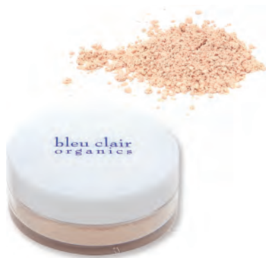
ローズリッチ UV パウダー SPF50+/PA++++ 6g

国内最高値の紫外線ガード力。 SPF50+/PA++++ でさらに優しい使い心地の ローズリッチ UV パウダー。 紫外線だけでなく近赤外線を防御する成分 を配合し、お肌をあらゆる光から守ります。 タルク・ナノ粒子不使用。粒子は天然由来 成分でコーティング。白浮きの無いナチュラルな カバー力、潤い、透明感、さらっとしたフィット感と 軽さの適度なバランスを実現したスキンケア・ファン デーションです。