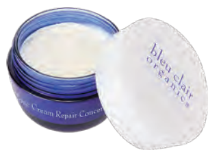
ローズクリームリペアコンセントレート (保湿クリーム)30g