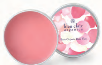
ローズオーガニックヘアワックス (オーガニックヘアワックス)30g