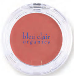
アプリコットコーラル