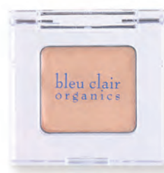
シャンパンアイボリー